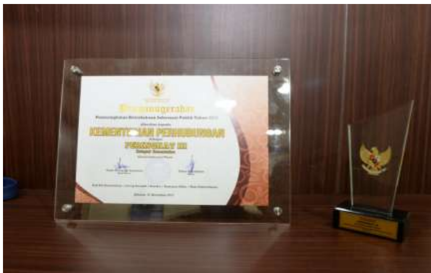
Foto : Piagam dan Plakat peringkat ke 3 Keterbukaan Informasi Publik tingkat Kementerian dan Lembaga

Selain mengikuti kegiatan pemeringkatan badan publik, Kementerian Perhubungan membentuk suatu wadah/forum untuk mengakomodir kebutuhan dari PPID Utama dan masing-masing PPID Pelaksana untuk dapat menyelesaikan segala masalah yang melingkupi dalam pelayanan informasi publik terkait sektor transportasi, khususnya dalam mengatasi sengketa informasi publik. Untuk memberikan pemahaman mendalam terkait pelaksanaan pelayanan informasi publik di lingkungan Kementerian Perhubungan, dipandang perlu melakukan sosialisasi maupun advokasi secara berkesinambungan kepada para pengelola informasi mengenai Prosedur Pelayanan Informasi yang