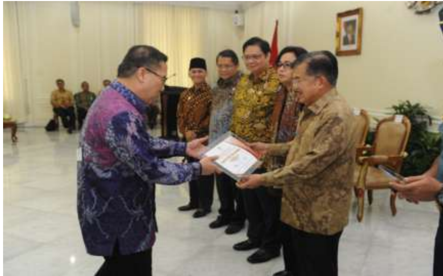
Foto : Presiden Republik Indonesia memberikan piagam kepada PPID Utama Kementerian Perhubungan